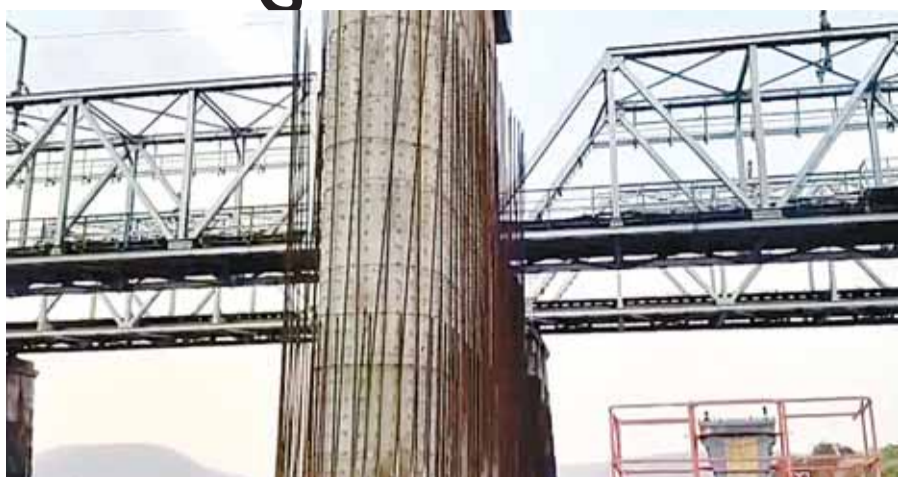
हरिभूमि न्यूज बनावर