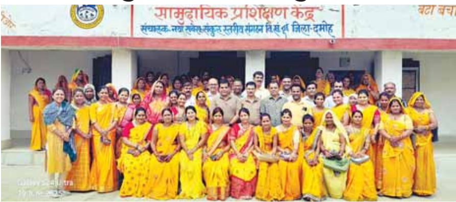
हरिभूमि न्यूज जबेरा

मध्य प्रदेश राज्य ग्रामीण आजीविका मिशन के द्वारा शासन की नीति के अनुरूप सामुदायिक संस्थाओं को मजबूत बनाने के लिए प्रशिक्षण के माध्यम से निरंतर कार्य किया जा रहा है। जिससे सामुदायिक संस्थाएं अपना मालिकाना हक समझ सकें और संस्थाओं की नैतिक जिम्मेदारी ले सकें। इसी के अनुरूप विगत दिवस सीटी सी पॉलिटेक्निक दमोह में नारी शक्ति बटियागढ़, सहारा दमोह एवं श्रीराम हटा की कार्यकारिणी सदस्यों का प्रशिक्षण आयोजित किया गया। इसमें संस्थाओं का समग्र क्षमता वर्धन के तहत समूह और ग्राम संगठन की बैठकों का आयोजन कृषि में नवाचार, प्राकृतिक खेती को बढ़ावा, बैंक लिंकेज एवं ऋण वापसी सीआर पी का कार्य प्रबंधन लोकोस एएस से कैसे कार्य किया जाए मॉडल सीएफ की कार्य प्रणाली वित्तीय प्रबंधन सीआईएफ की