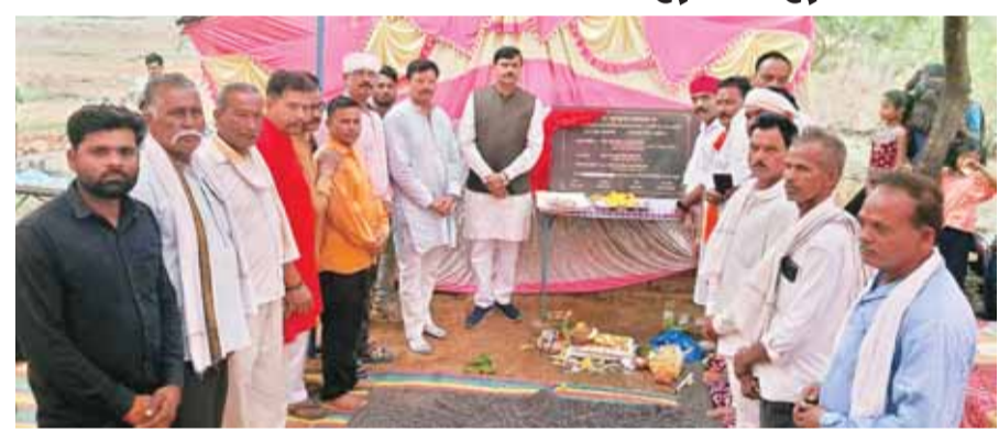
हरिभूमि न्यूज जबेरा